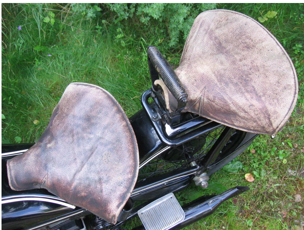
Vaade sõiduki istme(te)le