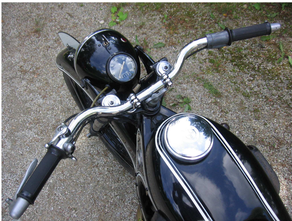
Vaade sõiduki juhtimisseadmetele